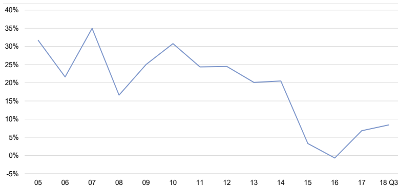
图1 房地产投资同比增速，2005年-2018第三季度

本季度土地拍卖新规出台，对预售时间和分期开发作出了相应限制规定，以维护房地产市场秩序。展望全年，随着供应持续加大，一手住宅需求会进一步得到有效释放，供需局面将得到缓解；而另一方面房地产调控政策继续收紧，一手住房均价上涨或将放缓。 ■