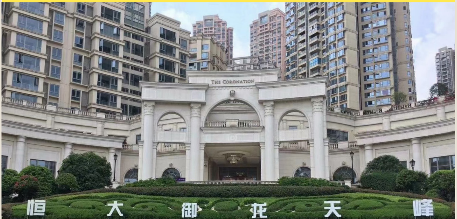
图片：恒大御龙天峰，江北区